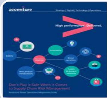
Global Operations Megatrends Study — Technology Vision 2014 Accenture