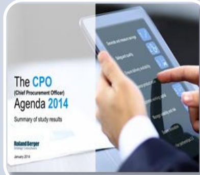
The CPO Agenda 2014 Roland Berger