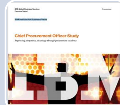
CPO Study 2013 — Improving competitive advantage through procurement excellence IBM Institute for Business Value